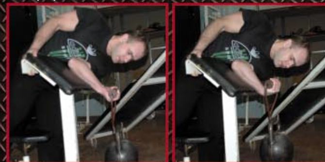
Podnoszenie obciążenia na nadgarstek. Przedramię oparte na modlitewniku. 3 x 8-10