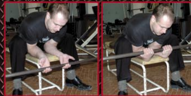
Podnoszenie sztangi na nadgarstek. Przedramię oparte na płaskiej ławeczce. 3 x 6-8