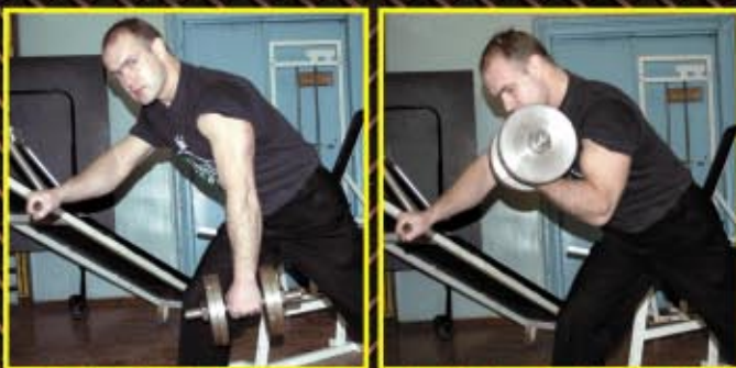
Podnoszenie hantli na biceps pełnym ruchem. 3 x 8-10