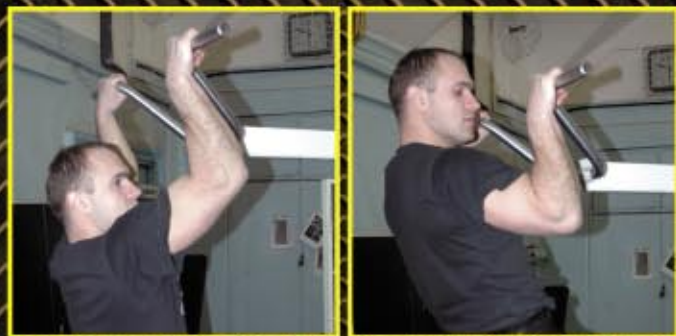
Podciąganie na drążku nachwytem od kąta prostego 4 x 12-20