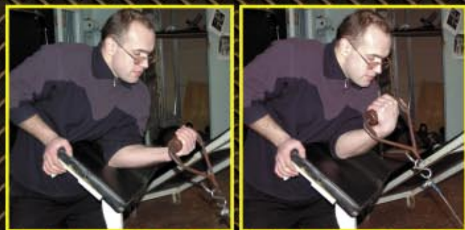
Podnoszenia na biceps z wykorzystaniem wyciągu regulowanego i grubego uchwytu. Łokieć oparty o modlitewnik. 4 x 8-12