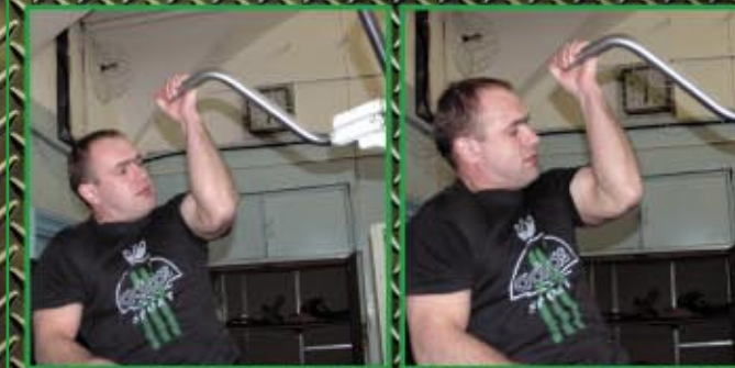
Podciąganie na drążku jedną ręką (z kąta prostego). 3 x 5-6