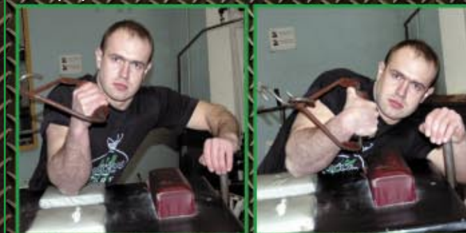
Ściąganie na wyciągu regulowanym z wykorzystaniem grubego uchwytu. 4 x 8-12