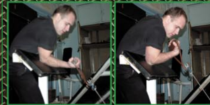
Podnoszenie na biceps z wykorzystaniem wyciągu regulowanego i grubego uchwytu. Łokieć oparty o modlitewnik. 4 x 8-12