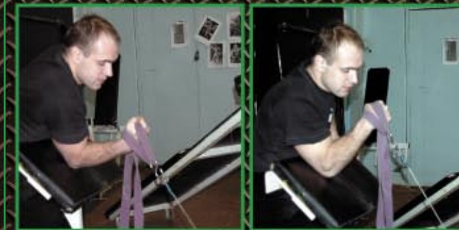
Skreć nadgarstka na zewnątrz z wykorzystaniem wyciągu regulowanego, paska judo. Łokieć oparty o stół. 4 x 8-12