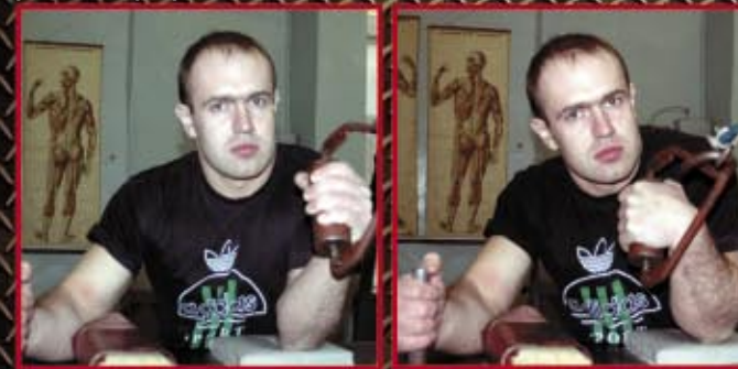
Ściąganie na nadgarstek z wykorzystaniem wyciągu regulowanego. Łokieć oparty o stół. 3 x 10-15