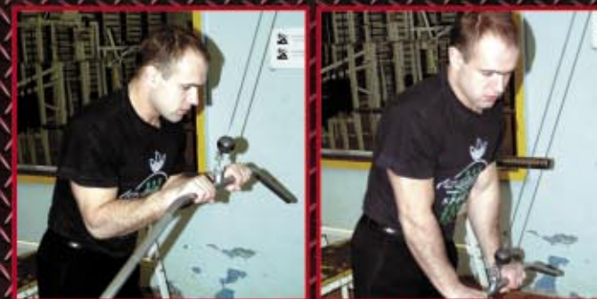
Ćwiczenie na triceps. 4 x 10