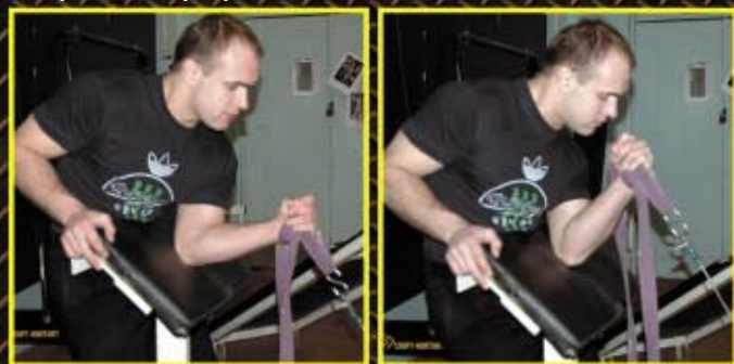
Skreć nadgarstka na zewnątrz z wykorzystaniem wyciągu regulowanego, paska judo. Łokieć oparty o stół. 4 x 8-12