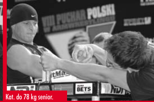
Kat. do 78 kg senior.