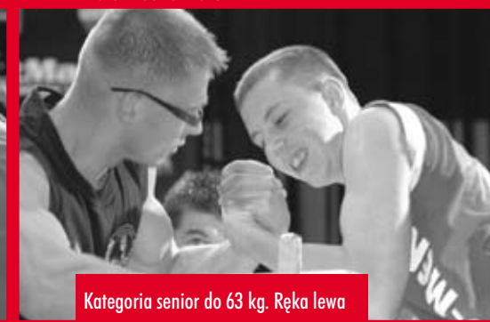
Kategoria senior do 63 kg. Ręka lewa