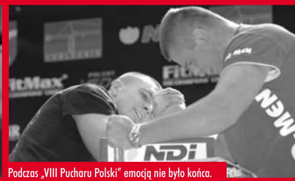
Podczas „VIII Pucharu Polski” emocję nie było końca.