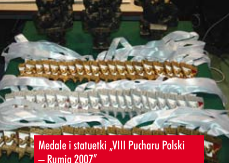
Medale i statuetki „VIII Pucharu Polski – Rumia 2007”