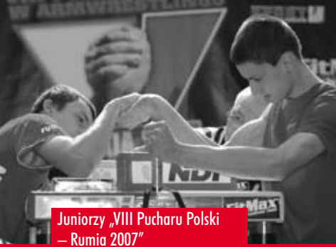
Juniorzy „VIII Pucharu Polski – Rumia 2007”