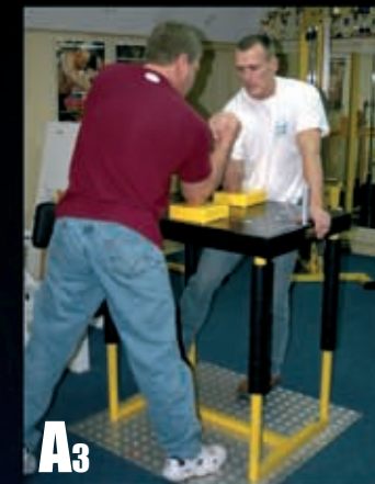
A3 Nogę ręki walczącej wystawiamy do przodu.