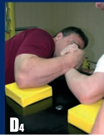
D4 Dobijamy rękę przeciwnika do poduszki.