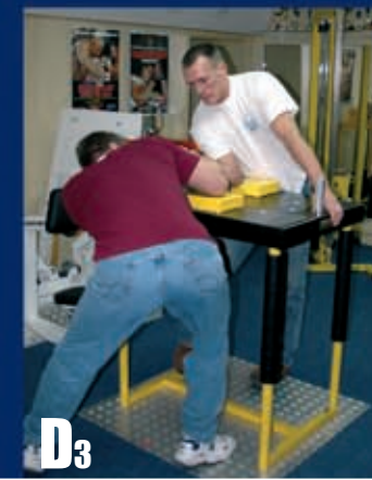
D3 Maksymalnie odchylamy tułów jednocześnie do tyłu i w bok.