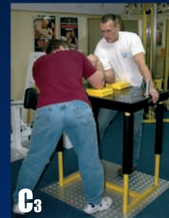
C3 Odchylamy tułów do tyłu.