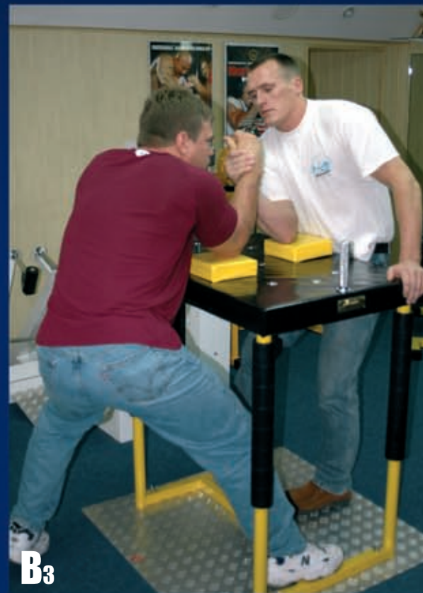
B3 Zginamy w kolanie nogę analogiczną do ręki walczącej.