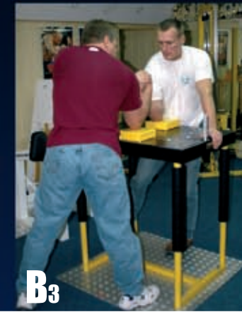
B3 Robimy skręt do wewnątrz walczącego barka.