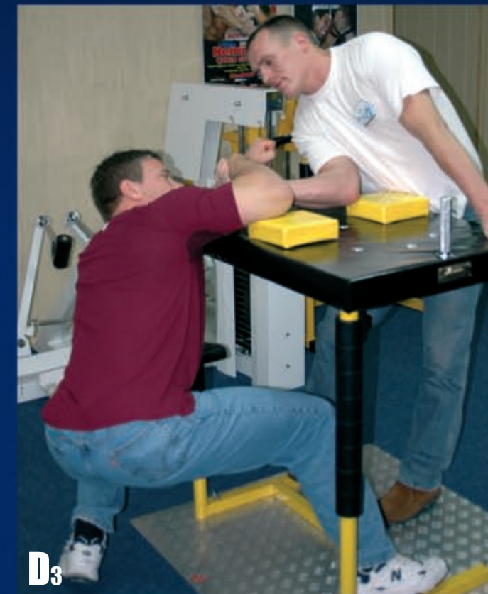
D3 Bark ręki walczącej zbliżamy do poziomu blatu stołu.