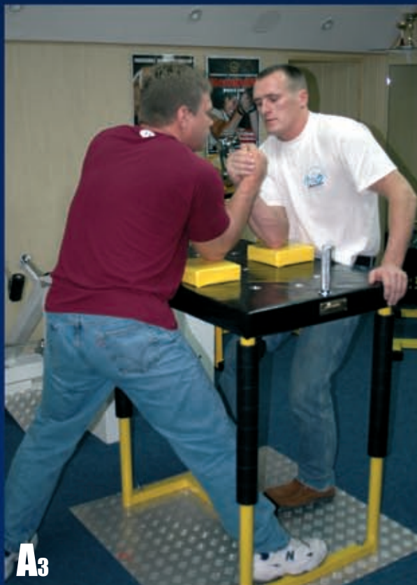
A3 Nogę analogiczną do ręki walczącej wystawiamy do przodu.