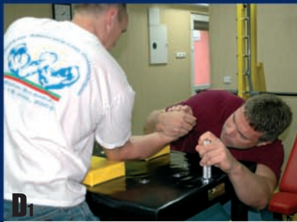
D1 Ręka trzymająca drążek schodzi poniżej krawędzi stołu.