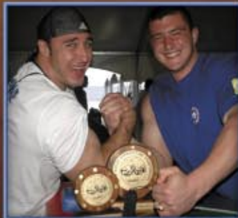
Jak widać humor dopisywał dwóm najlepszym zawodnikom w kategorii +110 kg. W tym roku Voevoda był silniejszy od Pushkara zarówno na lewą jak i na prawą rękę. Oba tych zawodników od reszty kategorii +110 kg dzieli ogromna przepaść i wygląda na to, że jeszcze długo nikt nie zagrozi ich pozycji.