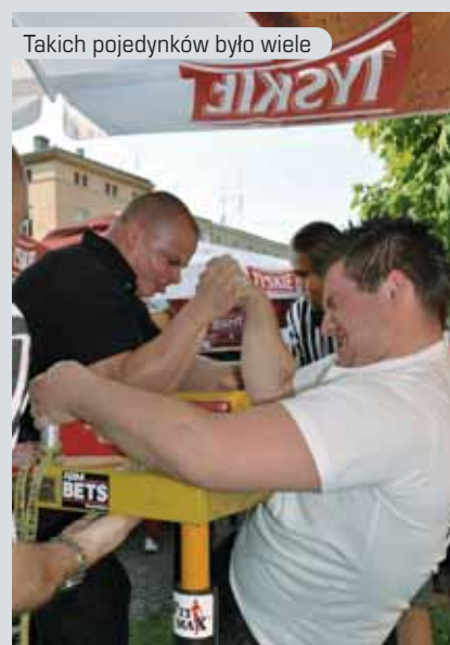
Takich pojedynków było wiele